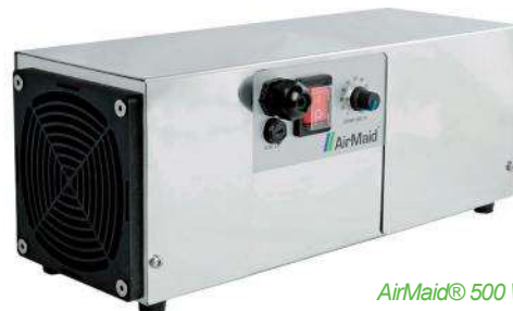
AirMaid® 500 W