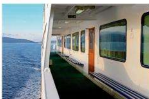
AirMaid® laivan hytissä

AirMaid® W on kevyt, siirrettävä laite, jonka voi asentaa myös kiinteästi. Ympäristöystävällinen ja kustannuksia säästävä tekniikka parantaa hajutilannetta merkittävästi. Sähköä laite kuluttaa vain vähän. Jätteiden, ruokien, savun, homeen, maalin jne. haju katoaa helposti. Myös bakteerien ja muiden allergisoivien aineiden määrä ilmassa vähenee.