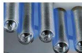
CGC "CORONA GLASS CELL"

CGC-tekniikka on ollut markkinoilla vuodesta 1996.